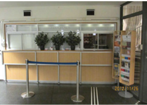
Reception på FRV.