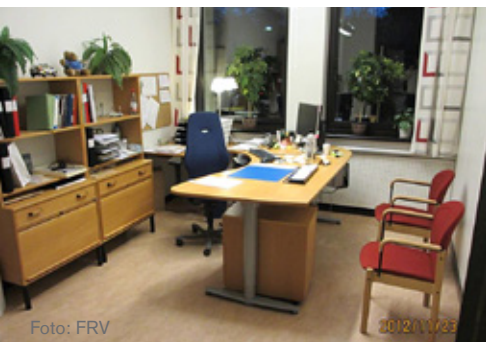
Förhöringsrum på FRV.