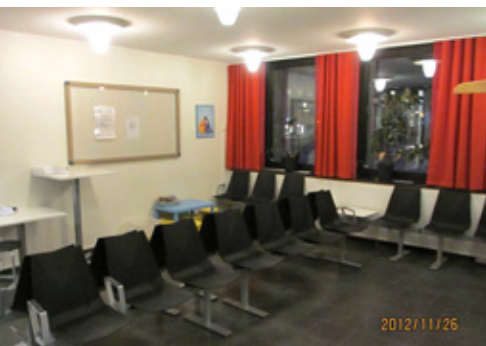
Väntrum på FRV.